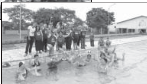
Aulas de hidroginástica

No final de dezembro, alunos, professores e funcionários do Programa Integrar participaram de uma grande confraternização para marcar o encerramento das atividades do ano de 2011.