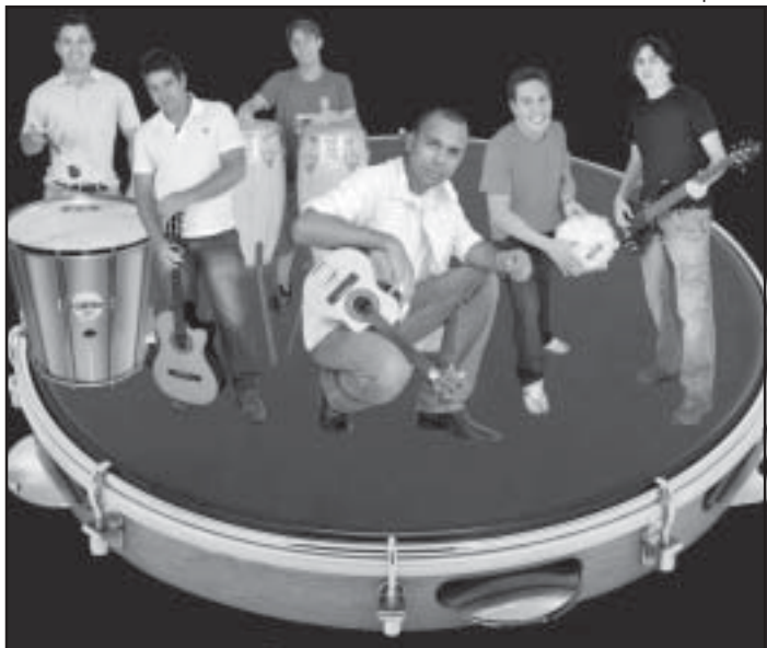
Foto: Xaveco no Imporium

Neste domingo, 22 de janeiro, a partir das 18 horas, tem samba e pagode com o Grupo Xaveco. O Imporium fica na rua dos Xavantes, no setor de barzinhos, perto do Unipam.