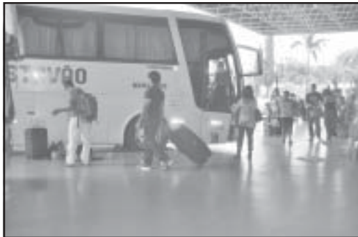
Passageiros de cidades vizinhas só poderão embarcar e desembarcar na Rodoviária de Patos de Minas.