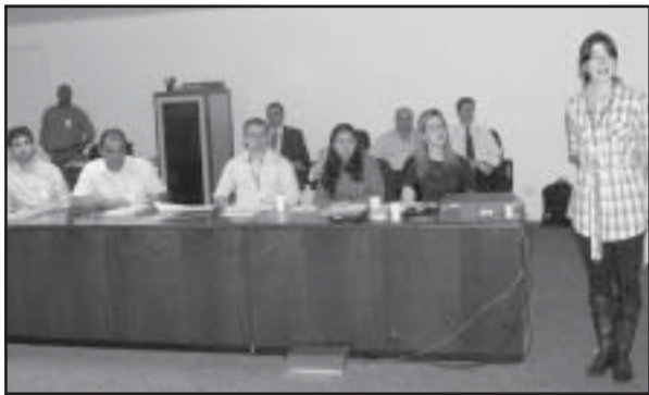
Representantes de cooperativas receberam treinamento para serem correspondentes do BDMG

Cooperativas de crédito do Triângulo e do Alto Paranaíba já podem oferecer, a partir deste mês, financiamentos de baixo custo a micro, pequenas e médias empresas da região. A iniciativa faz parte do projeto Correspondentes Bancários do Banco de Desenvolvimento de Minas Gerais (BDMG). O objetivo do Governo de Minas, por meio da instituição é facilitar o acesso a crédito para o pequeno empresário do interior do Estado.