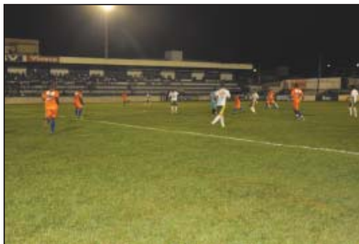
De virada, a equipe celeste bateu o time visitante, fechando o placar em 2x1.