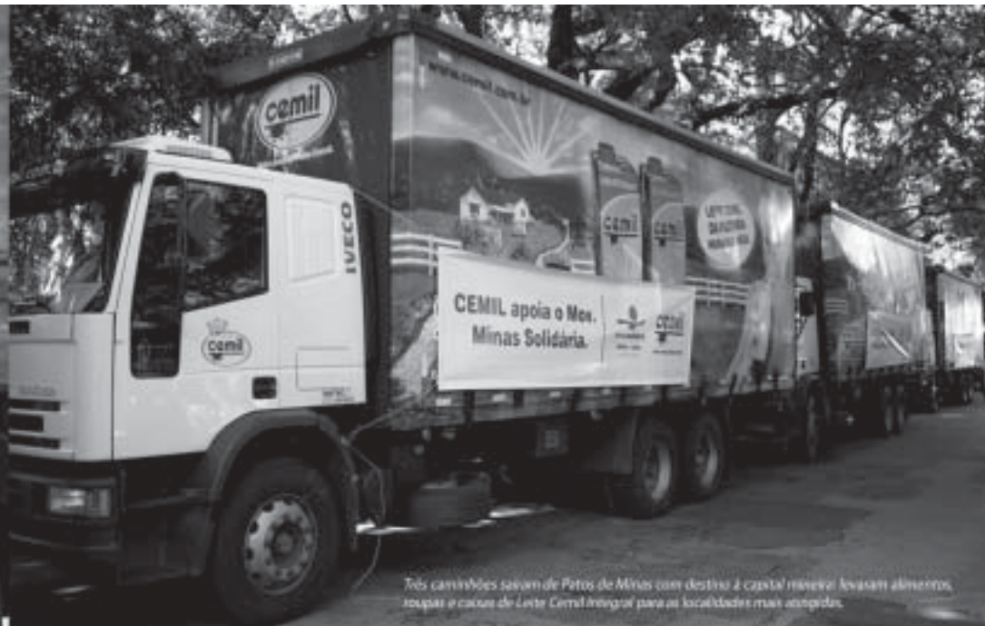
Três caminhões saíram de Patos de Minas com destino à capital mineira: levaram alimentos, roupas e caixas de Leite Cemil Integral para as localidades mais atingidas.