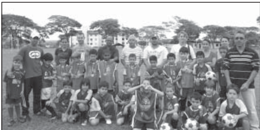
Alunos do futebol Petiz após premiação juntamente com seus pais